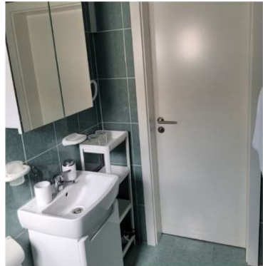
„Lipa Mare“ Apartman 4+1, Vir